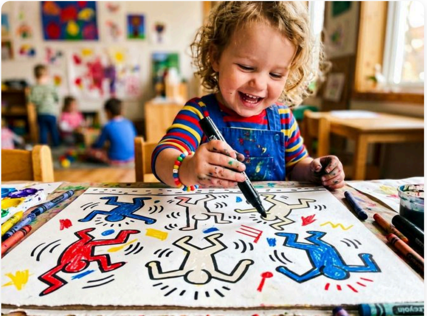
☞ Así queda la actividad — fotografía del aula