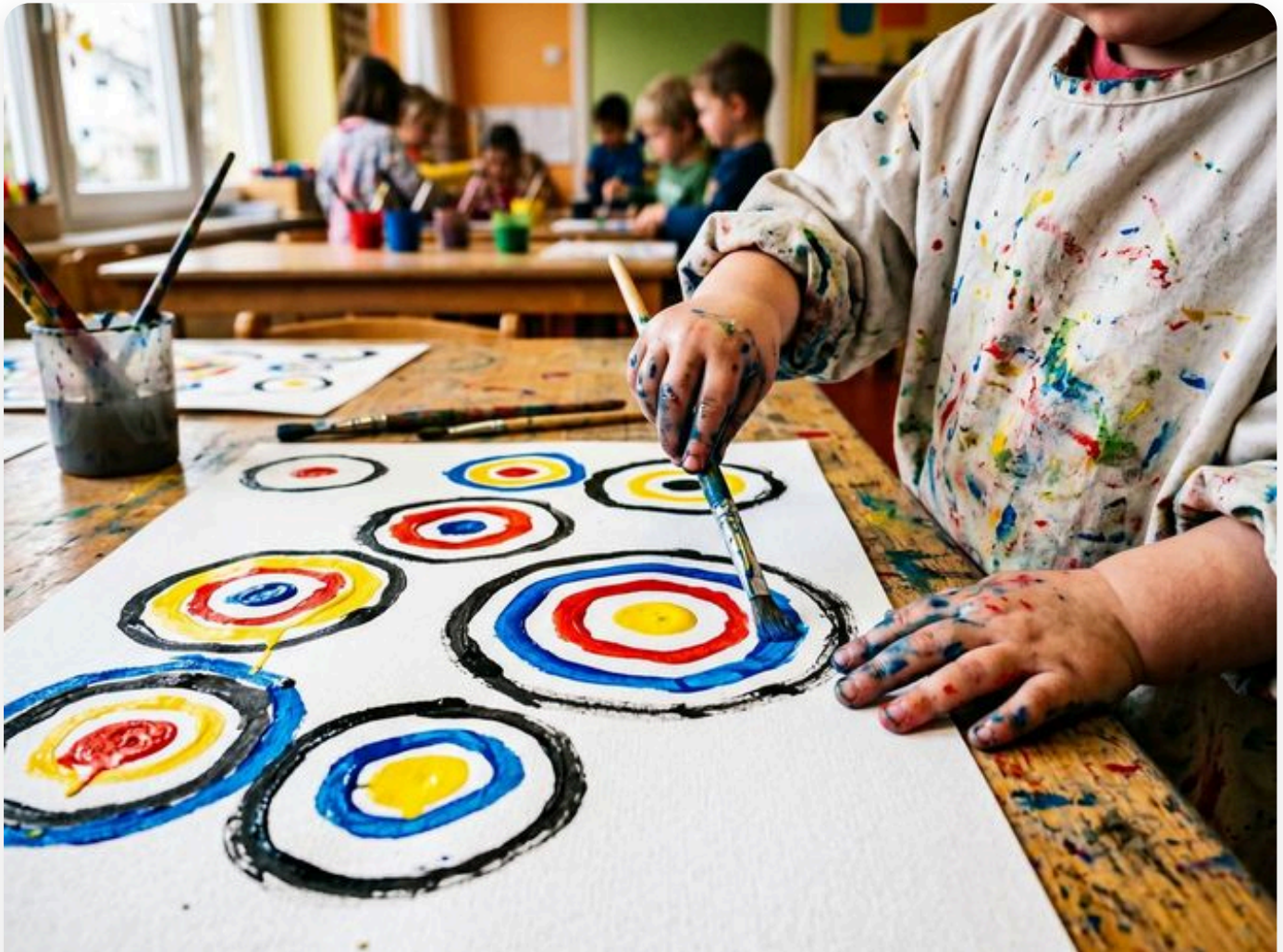
☞ Así queda la actividad — fotografía del aula