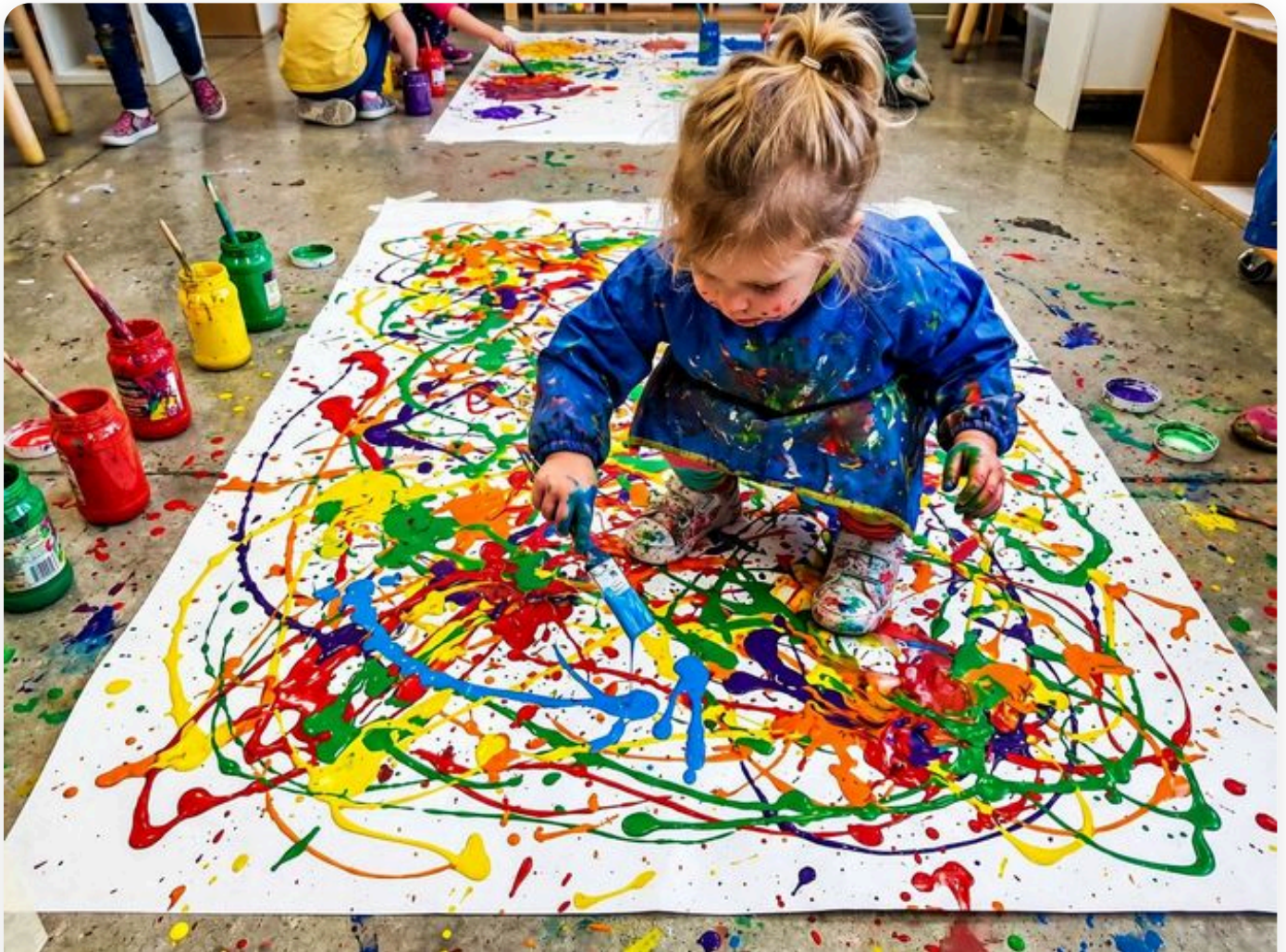
☞ Así queda la actividad — fotografía del aula