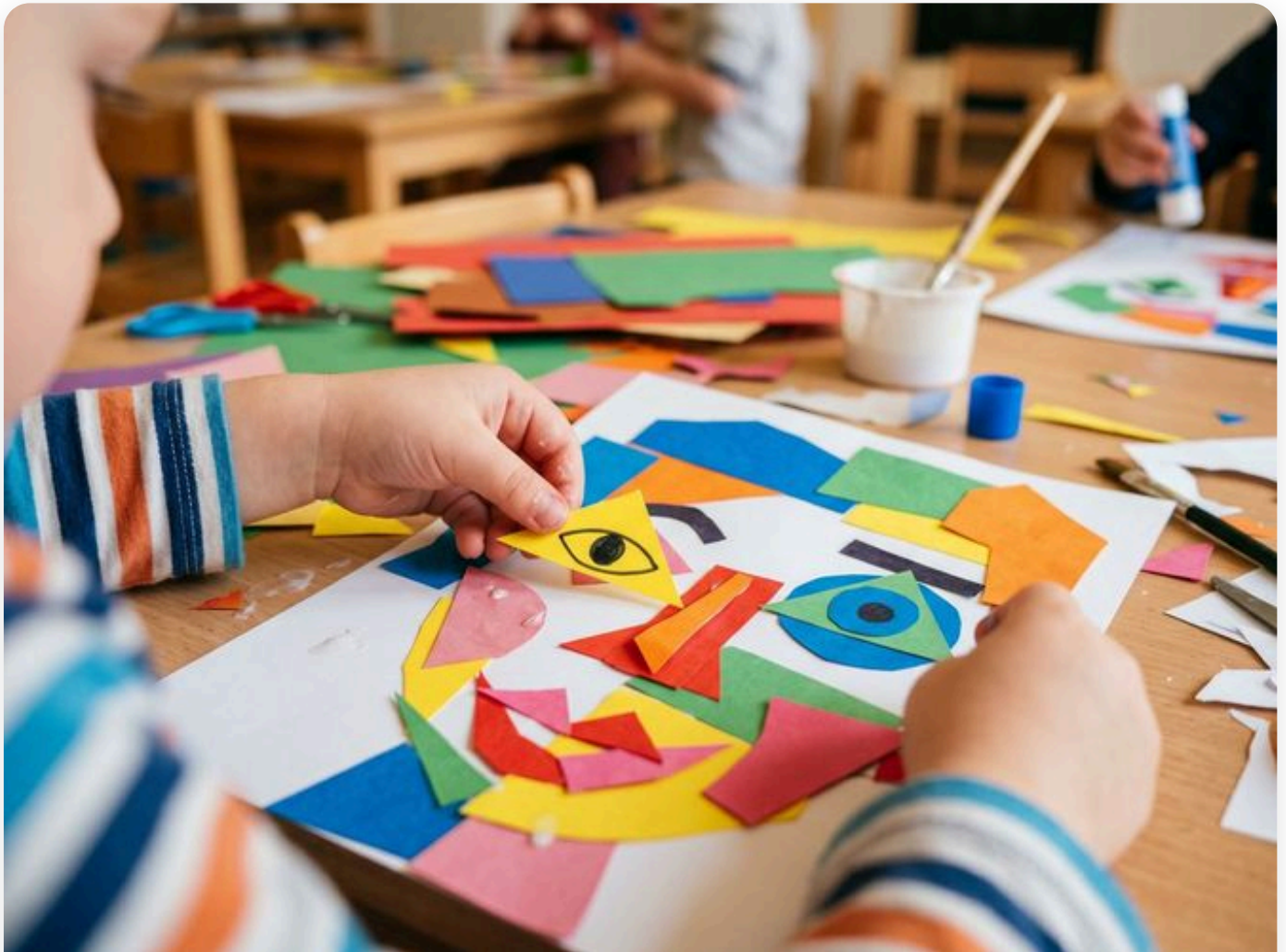
📷 Así queda la actividad — fotografía del aula