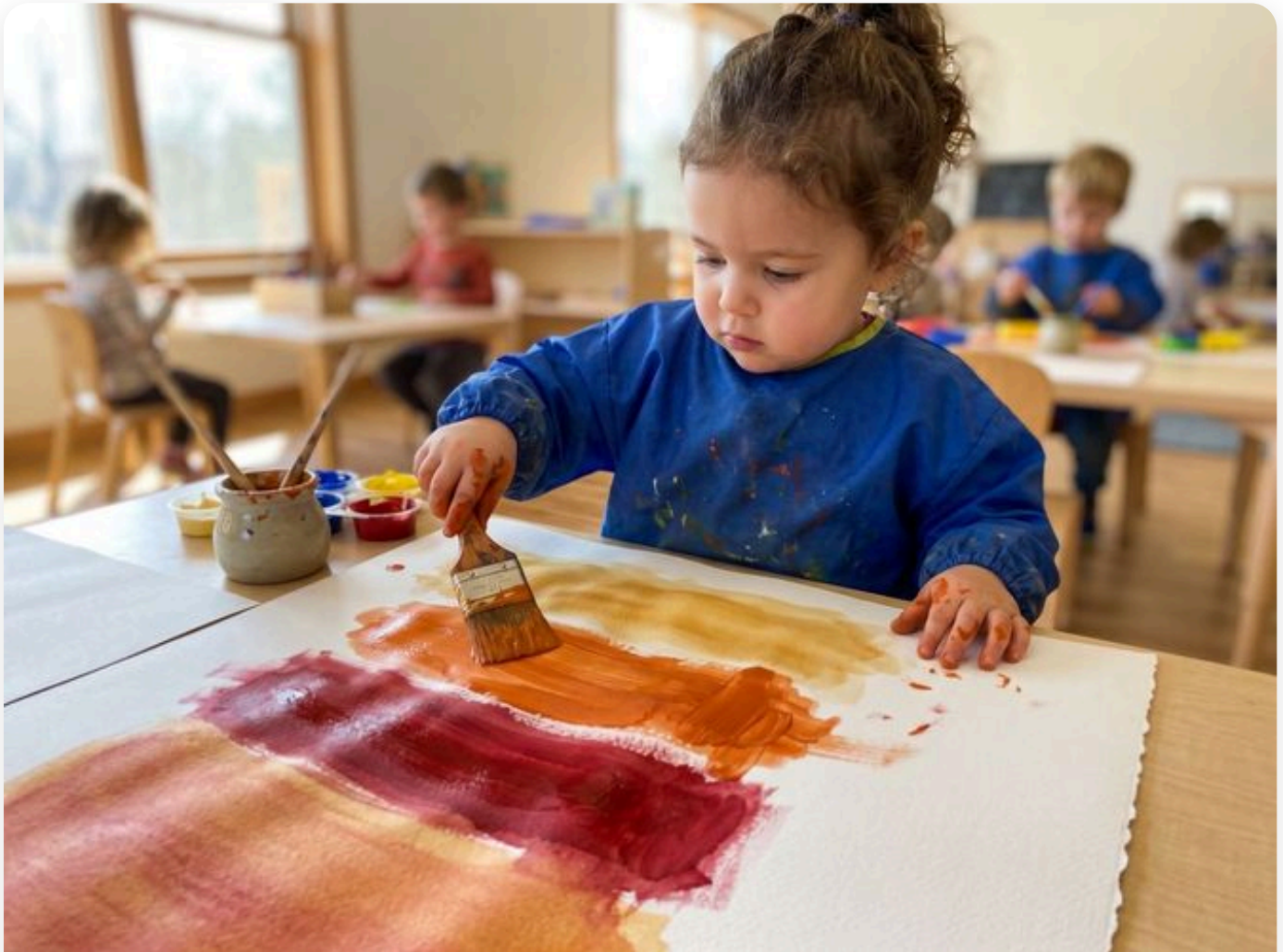
☞ Así queda la actividad — fotografía del aula