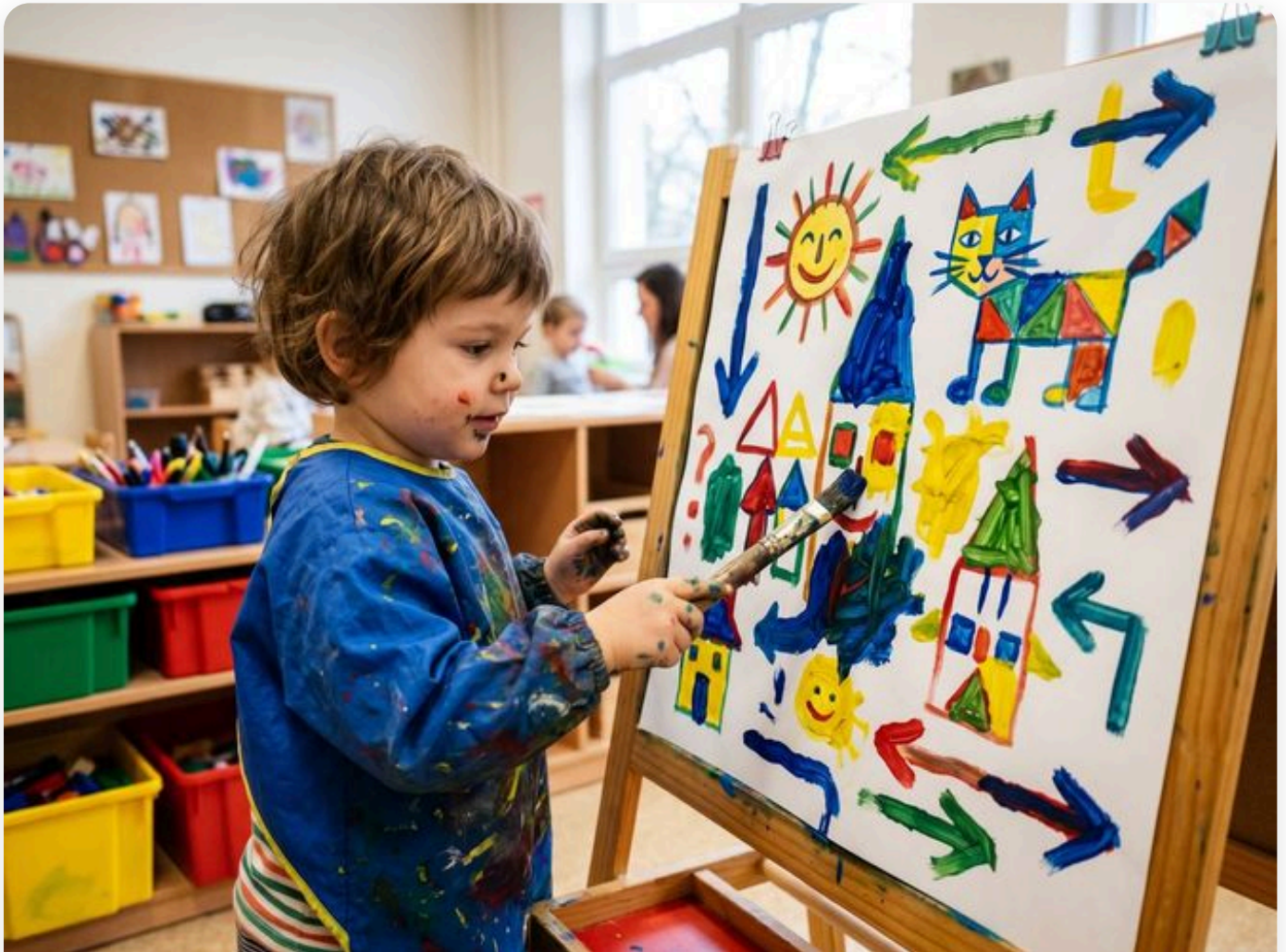
☞ Así queda la actividad — fotografía del aula