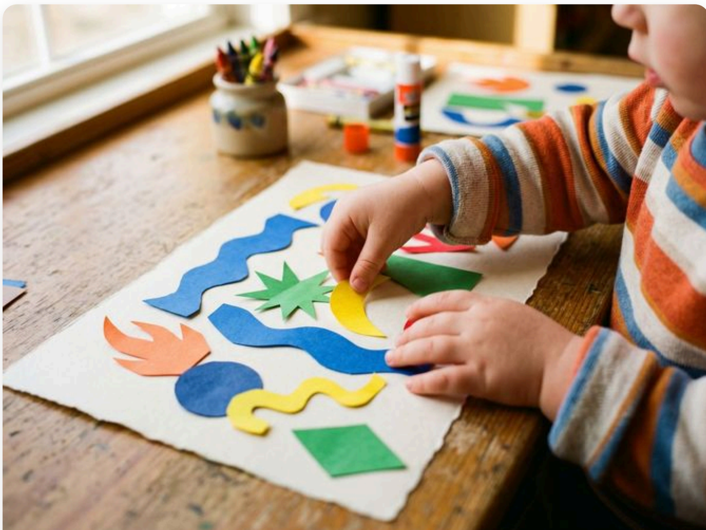
☞ Así queda la actividad — fotografía del aula