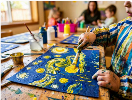
04 Van Gogh