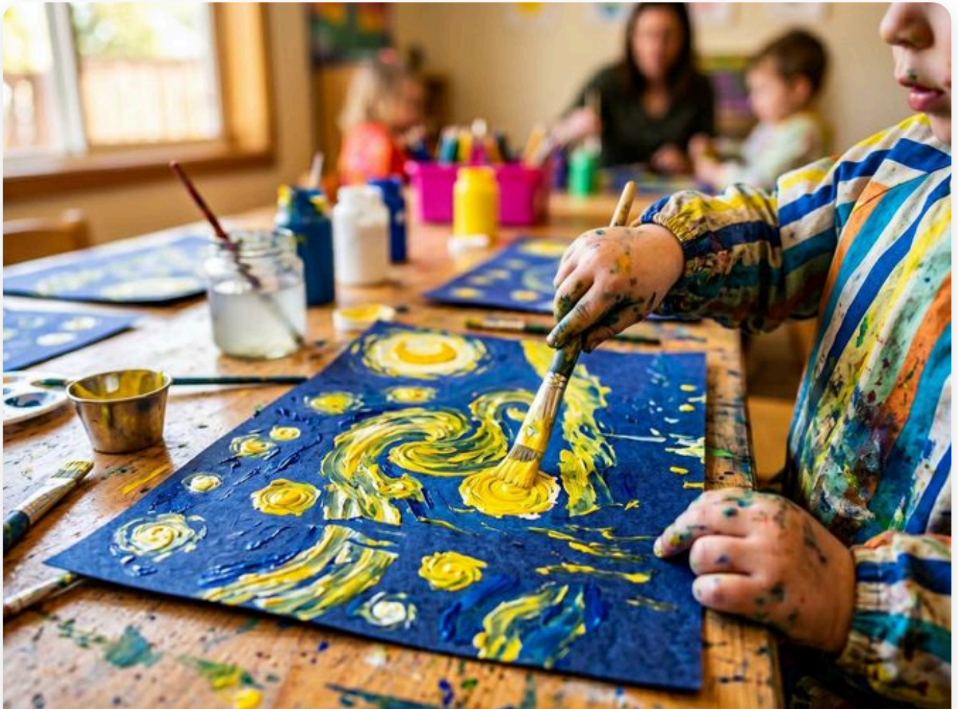
☞ Así queda la actividad — fotografía del aula