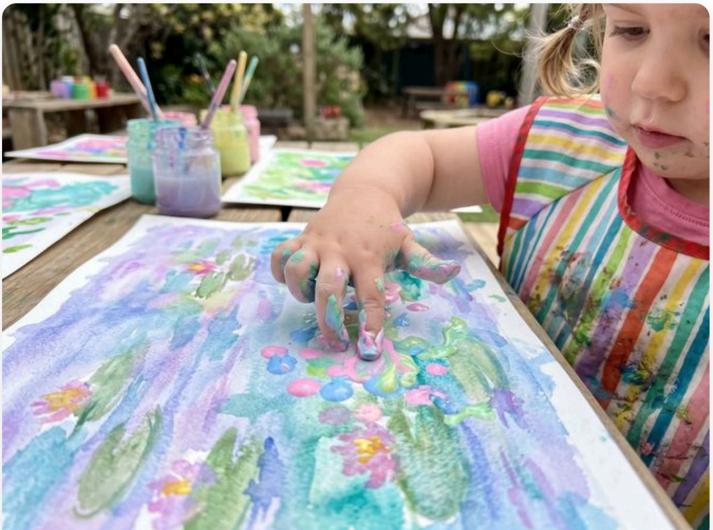
☞ Así queda la actividad — fotografía del aula