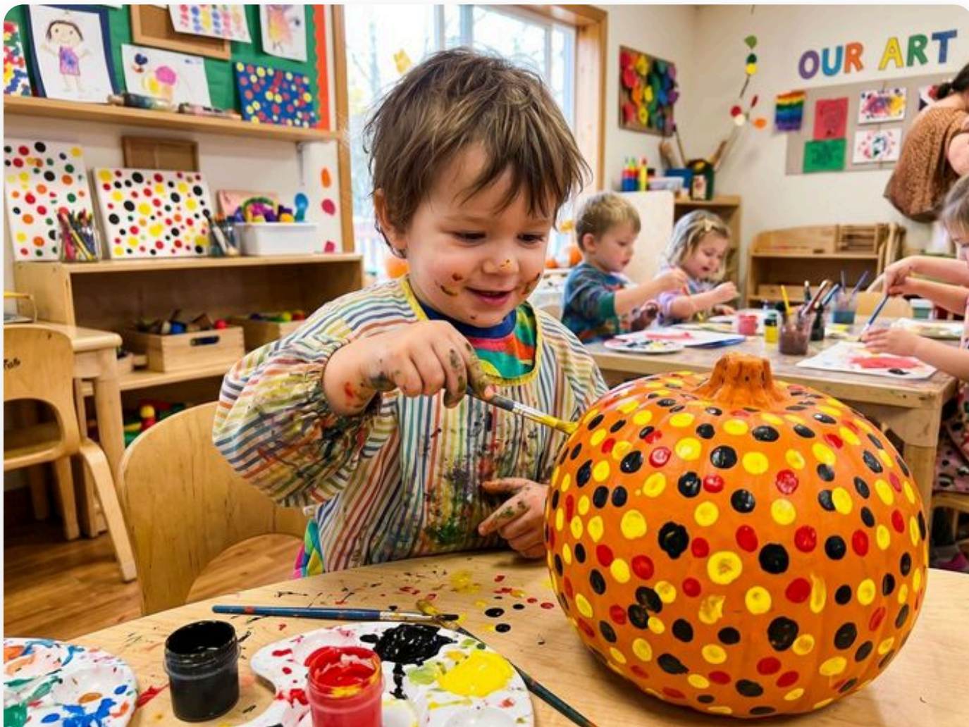
☞ Así queda la actividad — fotografía del aula