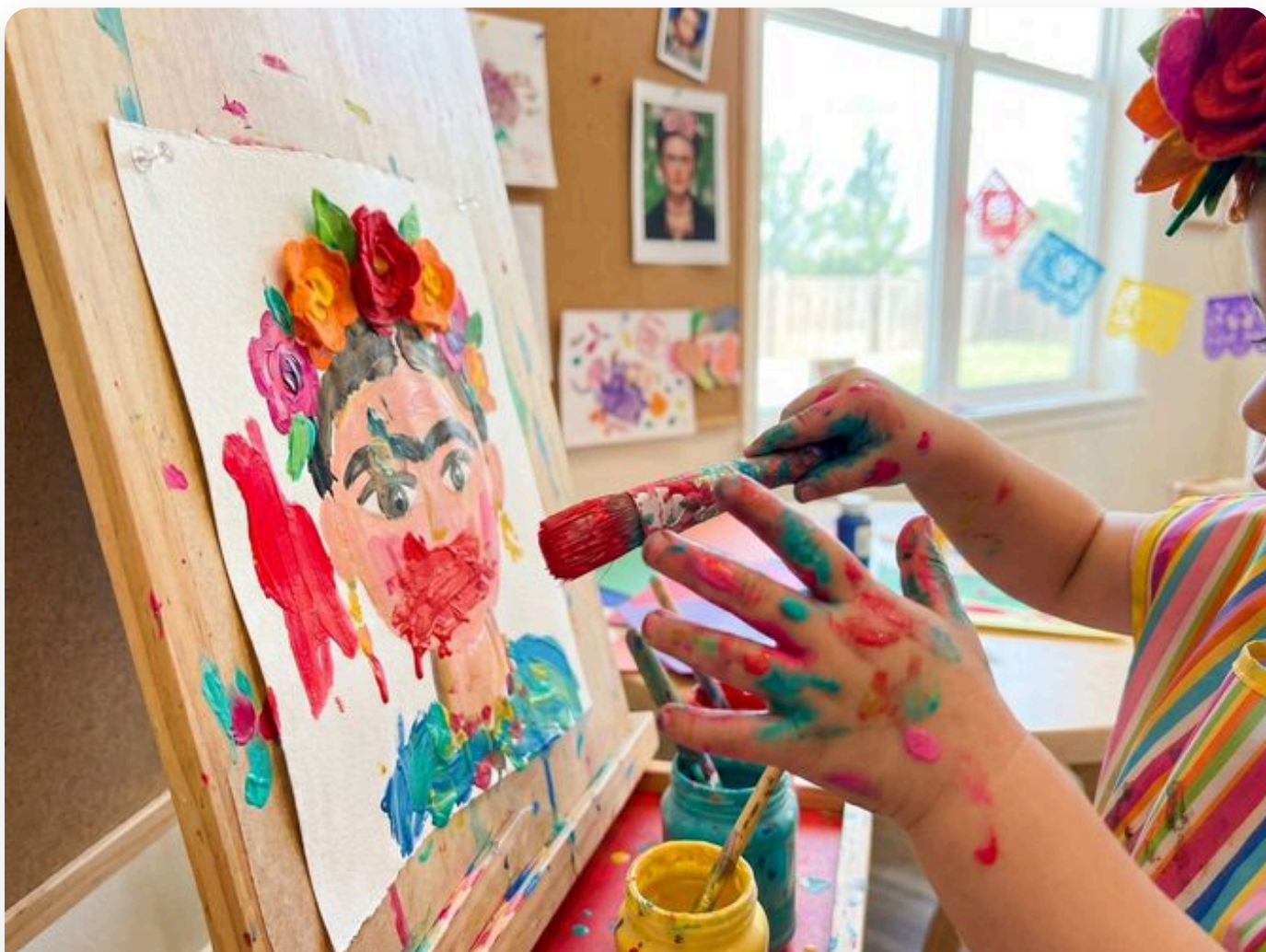
☞ Así queda la actividad — fotografía del aula